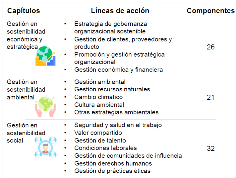
CUADRO 33 CAPÍTULOS DE SOSTENIBILIDAD