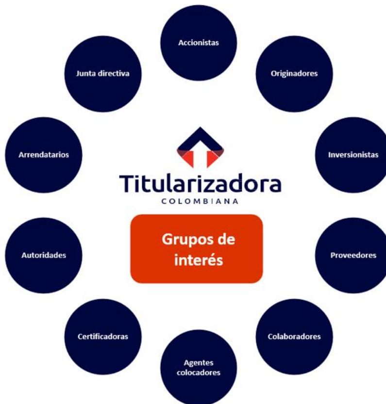
GRÁFICO 31. PARTES INTERESADAS

identificaron y priorizaron los grupos de interés con mayor incidencia en la toma de decisiones de la Compañía. Las partes interesadas se muestran en el gráfico 31.