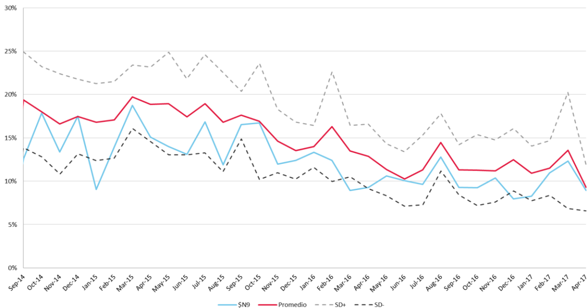
Gráfico 1 Tasa de prepago anualizada promedio de los Tips Pesos E frente a los Tips Pesos N-9. Septiembre 2014 – Abril 2017

La series subordinadas de la transacción, Tips Mz N-9 y Tips C N-9, se estructuraron con base en el excedente de intereses ( excess spread , diferencia entre la tasa de cartera y la tasa de emisión más gastos). Un alto índice de prepago podría afectar la generación de flujo de caja esperado para pagar estas series, lo cual se refleja en la calificación asignada. Como parte de la metodología de calificación, en el escenario de estrés para los títulos subordinados usamos un promedio de las tasas de prepago que han presentado históricamente las emisiones en pesos. Así, el resultado muestra que las series subordinadas Mz y C son más vulnerables al comportamiento de la tasa de los créditos hipotecarios del mercado y al efecto que estas generen en los índices de prepago. En el Gráfico 1 observamos que desde su emisión, la transacción ha presentado un nivel de prepago promedio menor (12.37%) al del promedio de los Tips N (14,6%) en ese mismo rango de fechas (septiembre 2014 – abril 2017)